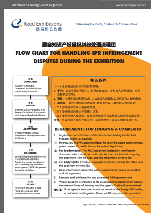
现场展示的知识产权海报样板。